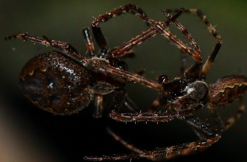
Nuctenea umbratica – Evropský pavouk roku 2017